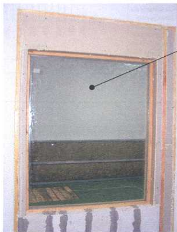
Zdjęcie nr 1 Pakiet szklany typu 6 x 16WES (Argon) x 4.4.4 na stanowisku badawczym (widok od strony komory nadawczej)

Warunki pomiarów: temperatura powietrza w komorach – nr 1 20 [°C], - nr 2 20 [°C] wilgotność powietrza w komorach – nr 1 63 [%], - nr 2 63 [%]