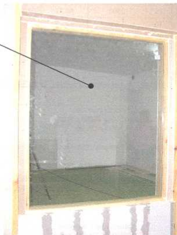
Zdjęcie nr 2 Pakiet szklany typu 6 x 16WES (Argon) x 4.4.4 na stanowisku badawczym (widok od strony komory odbiorczej)