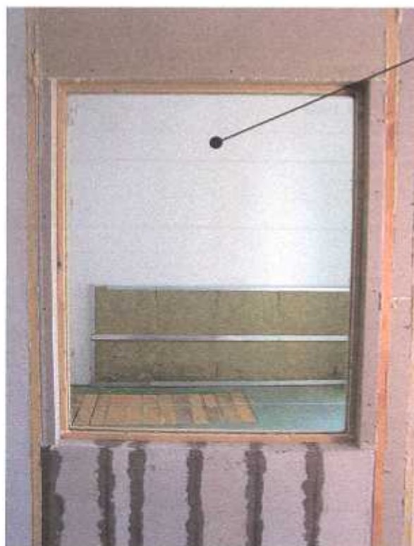
Zdjęcie nr 1 Pakiet szklany typu 4 x 16WES (Argon) x3.3.1 na stanowisku badawczym (widok od strony komory nadawczej)

Warunki pomiarów: temperatura powietrza w komorach – nr 1 23 [°C], - nr 2 22 [°C] wilgotność powietrza w komorach – nr 1 66 [%], - nr 2 66 [%]