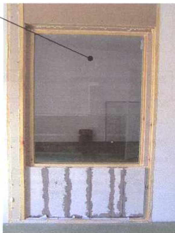
Zdjęcie nr 2 Pakiet szklany typu 4 x 16WES (Argon) x 3.3.1 na stanowisku badawczym (widok od strony komory odbiorczej)

Protokół z badań izolacyjności akustycznej bez pisemnej zgody CLDT nie powinien być powielany inaczej, jak tylko w całości.