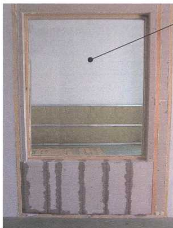
Zdjęcie nr 1 Pakiet szklany typu 6 x 16WES (Argon) x 6 na stanowisku badawczym (widok od strony komory nadawczej)

wilgotność powietrza w komorach – nr 1 65 [%], - nr 2 64 [%]